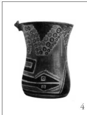
Figura 4. Vaso Yocavil Polícromo del valle de Yocavil (Catamarca).

Temporalmente se las asigna a momentos inmediatamente previos a la presencia efectiva de los inkas en el NOA, aunque intensamente vinculado a este proceso como una especie de mestizaje político frente (y como respuesta) al aparato expansivo estatal. Sin embargo, si pensamos en la vinculación de ciertas entidades socio – políticas para estos momentos frente a una determinada coyuntura histórica como puede ser la presencia inkaica, es probable que también pudieran operar otras situaciones socio - históricas que permitieran la interacción. O tal vez, una interacción siempre presente adquirió un tinte particular frente a lo que podría percibirse como extraño o amenazante. En estas posibles situaciones operan algunos denominadores comunes. En primer lugar, que la relación directa entre categoría cerámica y unidad étnica necesita ser revisada pensando en las dinámicas históricas más que en los criterios clasificatorios (Quiroga, 2003), y en segundo lugar, que las reconstrucciones del cuadro identitario étnico parece bastante más complejo y dinámico de lo que la disciplina arqueológica logró graficar.